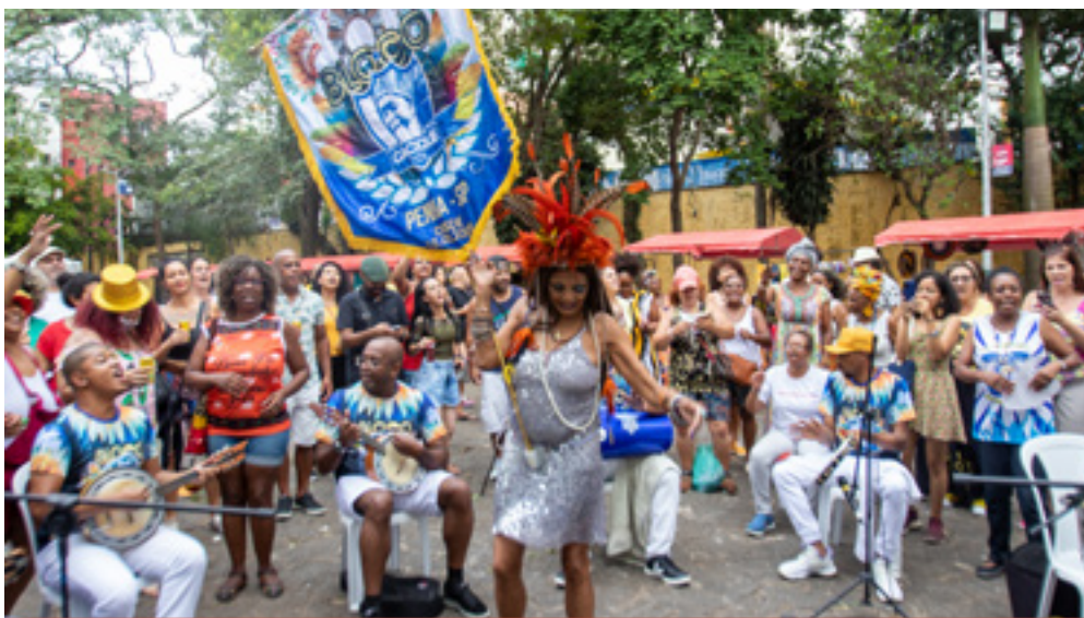
Bloco Cacique Social Club Penha, 2023

Também na área da cultura e do lazer, temos o Grêmio Recreativo Cultural Escola de Samba (GRCES) Nenê da Vila Matilde, o GRCES Flor de Vila Dalila e o GRCES Escola de Samba PENHA, além de vários blocos de Carnaval, como a Agremiação Recreativa Carnavalesca Bloco (ARCB) Chorões da Tia Gê, o Bloco Cacique Social Club Penha e o Cordão da Dona Micaela, que aproximam comunidades e ações culturais em seus espaços.