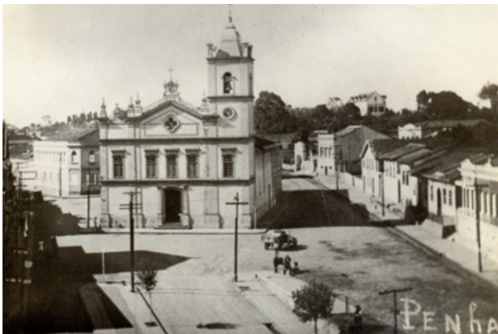
Santuário Nossa Senhora da Penha, 1925

Esse templo histórico tornou-se o núcleo original da ocupação, reunindo atividades religiosas, sociais e políticas da pequena vila em formação, o que o constituiu como local de parada obrigatória dos viajantes e tropeiros que circulavam