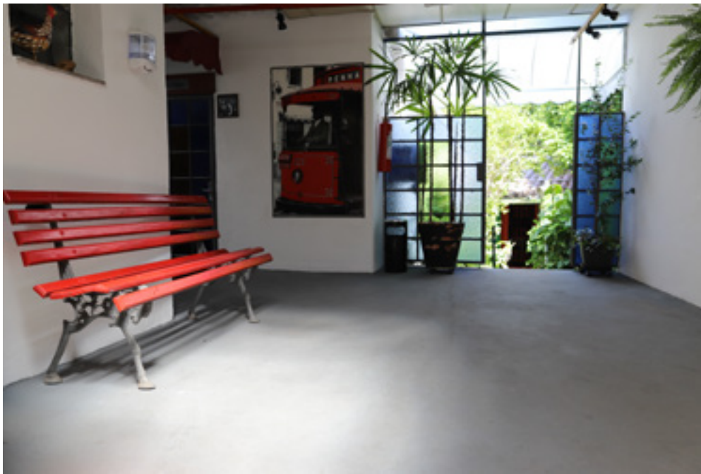
Hall de entrada do Memorial Penha de França, em 2019

Na parte térrea do sobrado, temos um escritório 4×4 m, uma sala de acervo e uma biblioteca 4×4 m, e também uma sala para exposições temporárias com balcão e café 4 × 4 m. A casa e os três cômodos externos são ligados por um corredor e um hall com jardim e banheiros masculino e feminino, além de área de serviços.