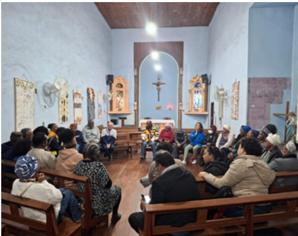
Reunião da comunidade na Igreja Nossa Senhora do Rosário dos Homens Pretos, 2025