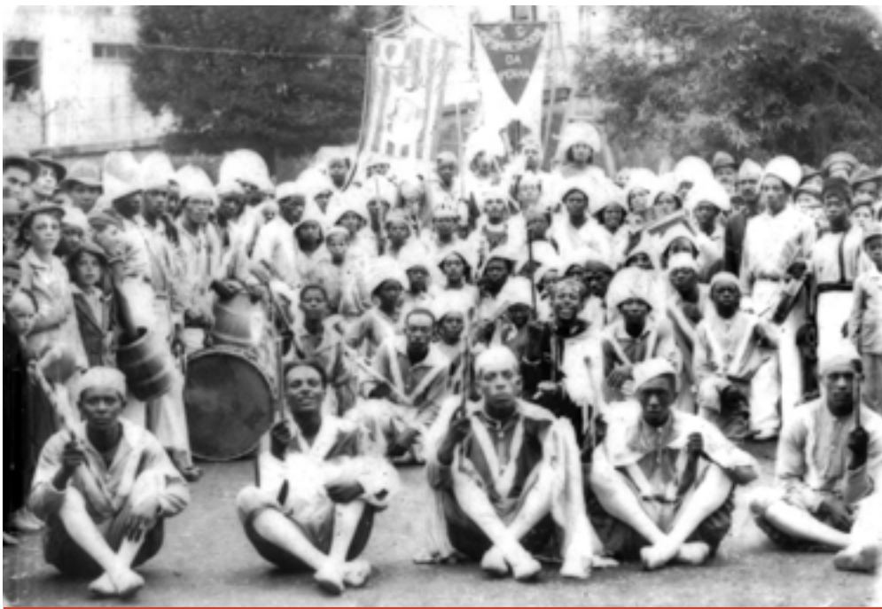
Cordão carnavalesco Os Desprezados da Penha , 1940

É importante dizer que ela foi tombada pelo Condephaat (Resolução n. 23/1982) e pelo Conpresp (Resolução n. 05/1991).