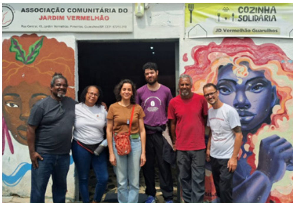
Museu Comunitário do Jardim Vermelhão, em 2025