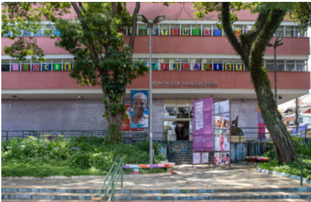
Centro Cultural Penha, 2020

Nessa mesma região do centro histórico, há o Centro Cultural Penha (CCP), espaço cultural público importante que abriga, em suas dependências, um teatro com 220 lugares com programas semanais, além de salas onde ocorrem oficinas culturais para diferentes públicos e idades, Projeto Guri, FabLab e uma biblioteca.