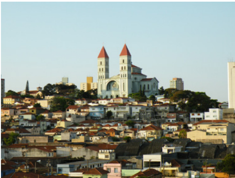
Basílica de Nossa Senhora da Penha, em 2010