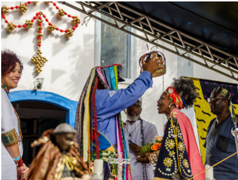
Coroação dos reis na 17ª Festa do Rosário dos Homens Pretos da Penha de França, em 2018

São também produzidos shows musicais, apresentações teatrais e exposições. Ao final da festa, é feita a retirada do mastro. Todas as ações envolvem uma equipe de produção e comunicação/divulgação, e toda a curadoria de artistas é discutida com a comunidade.