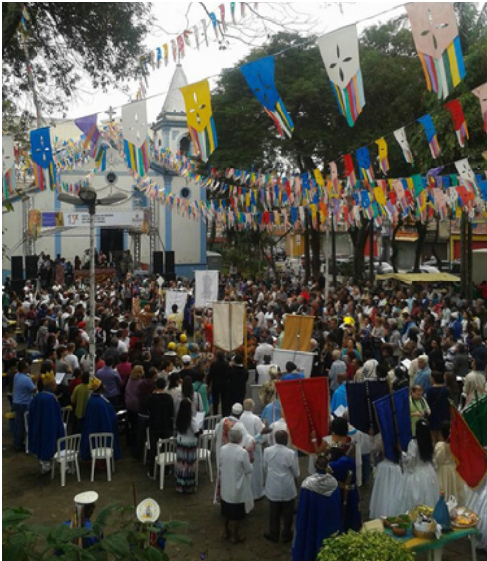
Missa Campal da 13ª Festa do Rosário dos Homens Pretos da Penha de França, em 2014