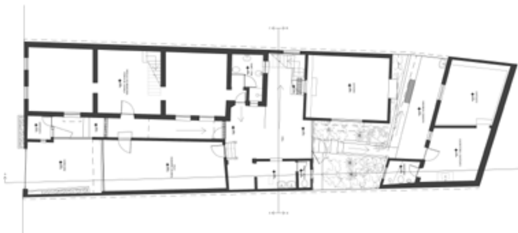
Planta baixa do Memorial Penha de França

Na área interna da casa, há três cômodos. O primeiro deles é uma copa para café e venda de bebidas em eventos, com uma estrutura para a montagem de pequenas exposições de fotografias contemporâneas ligadas aos cursos de fotografia e curadoria. No cômodo seguinte, há estantes abertas e fechadas para o armazenamento do acervo bibliográfico e de caixas com alguns documentos físicos. Já no último cômodo, mais reservado, mas com a janela direcionada para a porta de entrada, funciona o escritório do MCP. Nele, há estantes com documentos de rotina, mobiliário de escritório e armários para o acervo de DVDs e CDs do MPF.