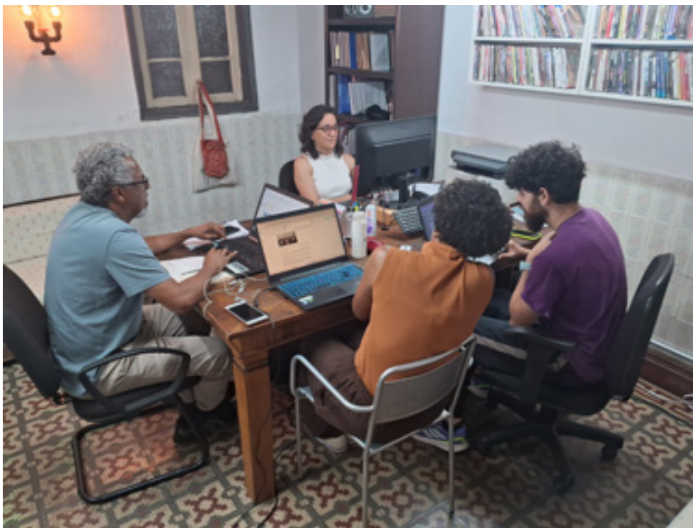
Escritório 4 × 4m, em 2025