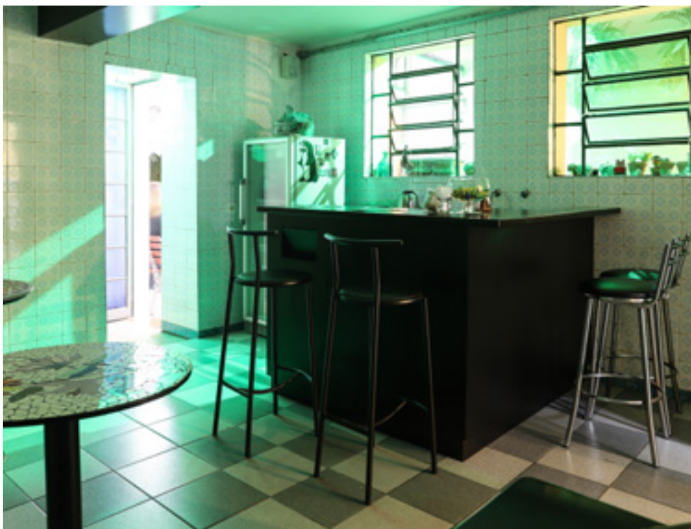
Sala 4 × 4m de exposições temporárias com espaço para café, em 2019