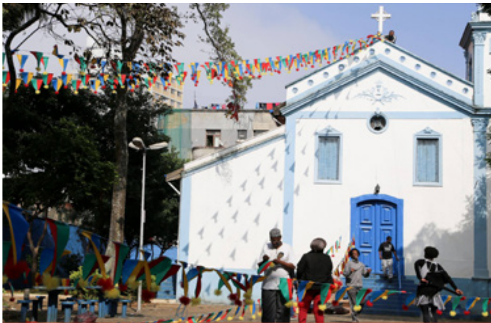
Igreja Nossa Senhora do Rosário dos Homens Pretos, 2016

Na área central, podemos destacar a Igreja Nossa Senhora do Rosário dos Homens Pretos, construída pela população escravizada no final do século XVIII; a Escola Estadual Santos Dumont, construída em 1913; e a Escola Estadual Nossa Senhora da Penha de França, datada de 1952 – todas tombadas pelo Conselho de Defesa do Patrimônio Histórico, Arqueológico, Artístico e Turístico do Estado de São Paulo (Condephaat). No final de 2018, por meio da Resolução n. 13/2018 do Conselho Municipal de Preservação do Patrimônio Histórico, Cultural e Ambiental da Cidade de São Paulo (Conpresp), o Departamento de Patrimônio Histórico (DPH) tombou o Outeiro Histórico da Penha, e o bairro passou a contar com 20 bens tombados.