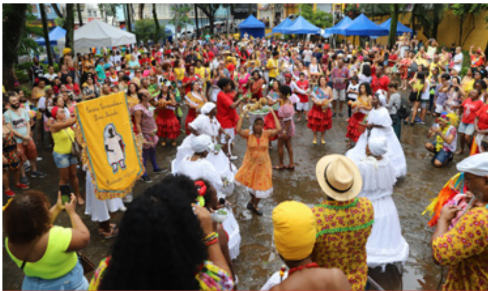
Cordão da Dona Micaela, 2020

A administração pública é feita pela Subprefeitura Penha, a qual possui uma supervisão de cultura no mesmo prédio da regional. Na área da educação temos a Diretoria Regional de Educação (DRE) que administra as escolas municipais da região e a Unidade Regional de Ensino – Leste 1, que administra as escolas estaduais que abrangem a subprefeitura Penha. O Centro de Referência de Assistência Social (CRAS) Penha é responsável pelos convênios e políticas na área da assistência social como os Centros de Atenção Psicossocial Social (CAPS) e os Núcleos de Convivência do Idoso (NCI).